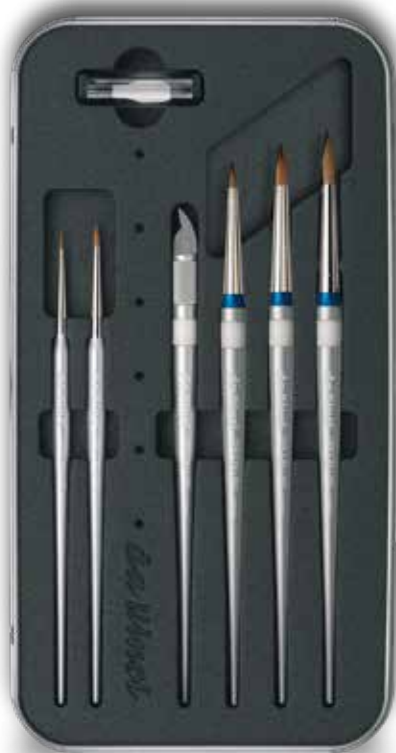
Set 11054 CERAMIC ZIRCON LINE COMPACT SHAPE KOLINSKY SET 11001 - 11003 - 11004 - 11005 - 11005K - 11006 - 11007