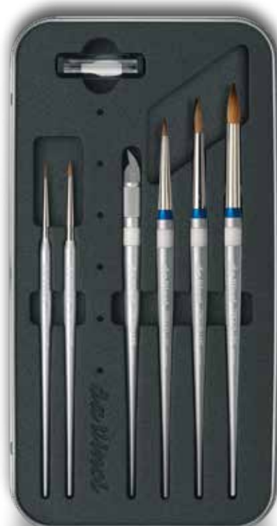
Set 11057 CERAMIC ZIRCON LINE CLASSIC COMPACT KOLINSKY SET 11001 - 11003 - 11004 - 11005 - 11005K - 11007 - 11008